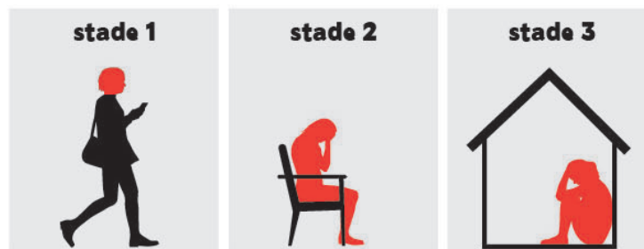
EVOLUTION DU SYNDROME

Facteur d'amplification des symptômes et souffrances.