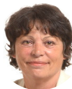
Michèle RIVASI Présidente, Députée européenne, Co-fondatrice du CRIIREM